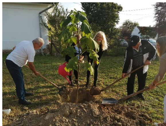
A polgármester felavatja a házat, a névadó személyek fát ültetnek az alkalom tiszteletére az alkotóház udvarán.

Az alkotóház három klubot működtet: Hatjáték klub, Nostalgia klub és Gyapjas klub.